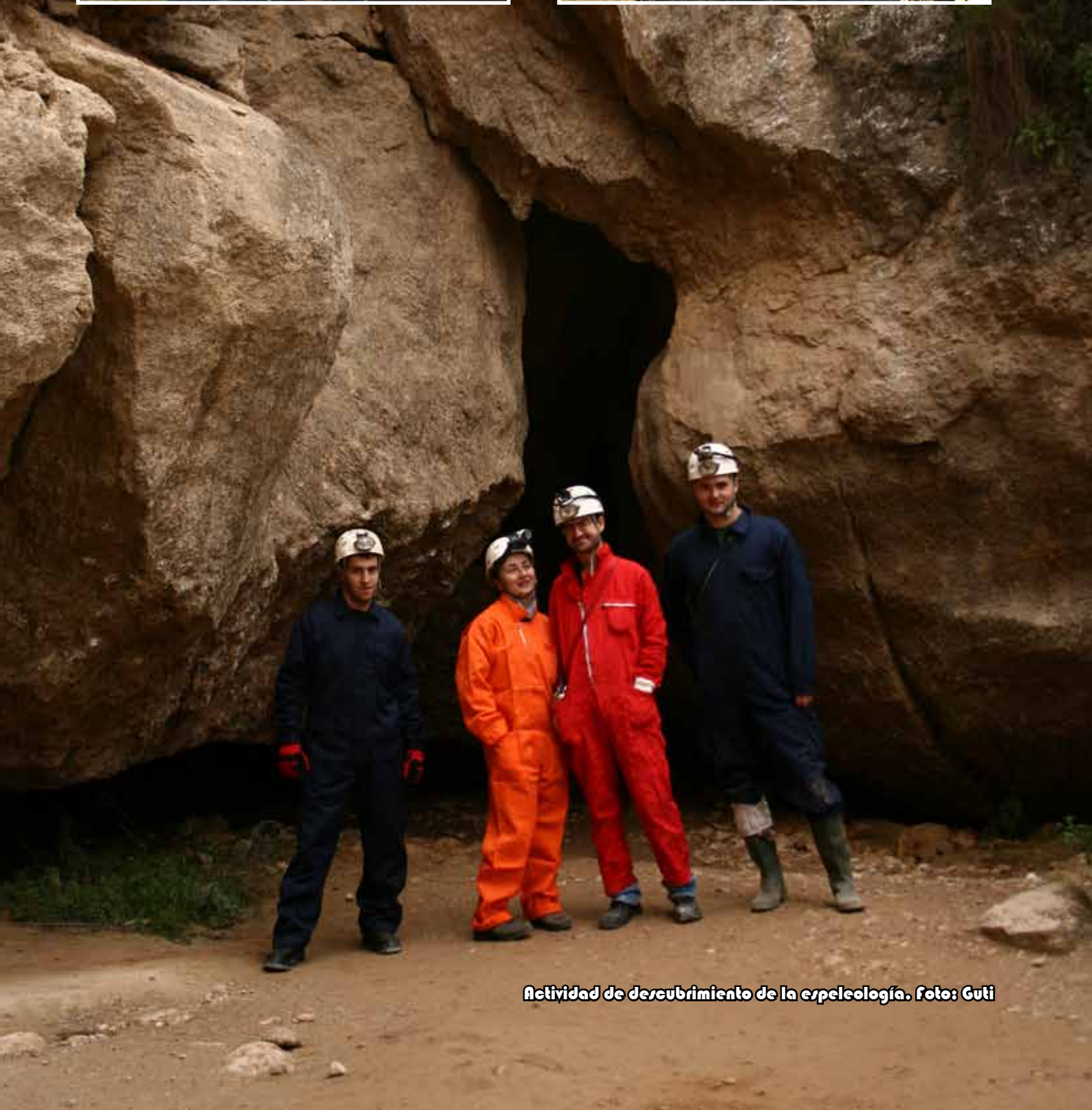
Actividad de descubrimiento de la espeleología.