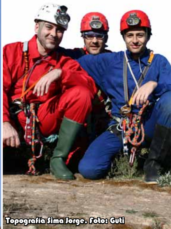
Topografía Sima Jorge.