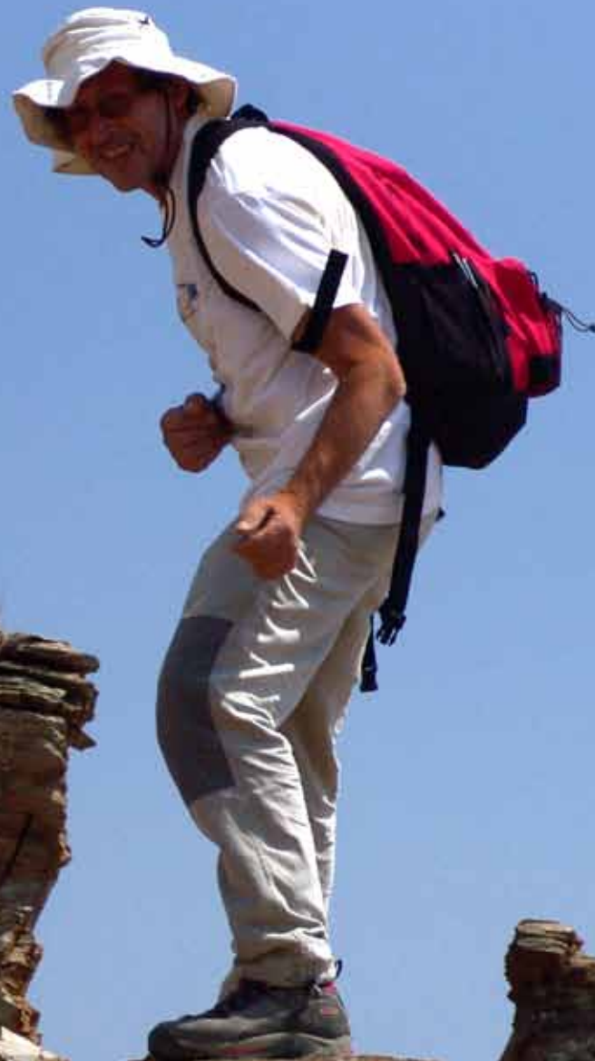
Sima del Ahorcado.