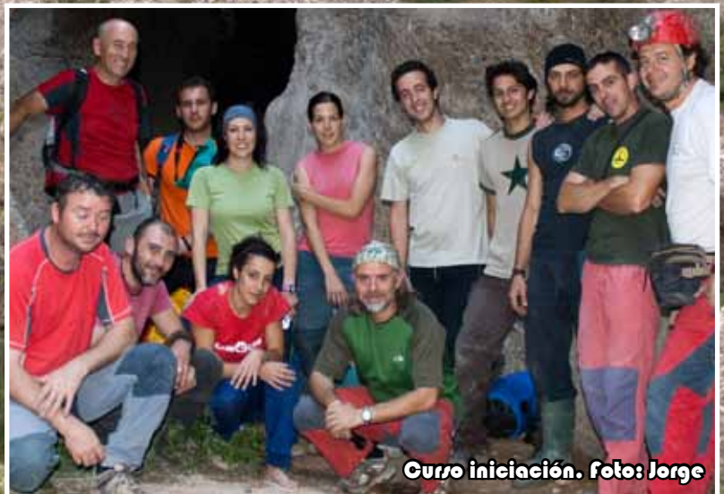
Curso iniciación.