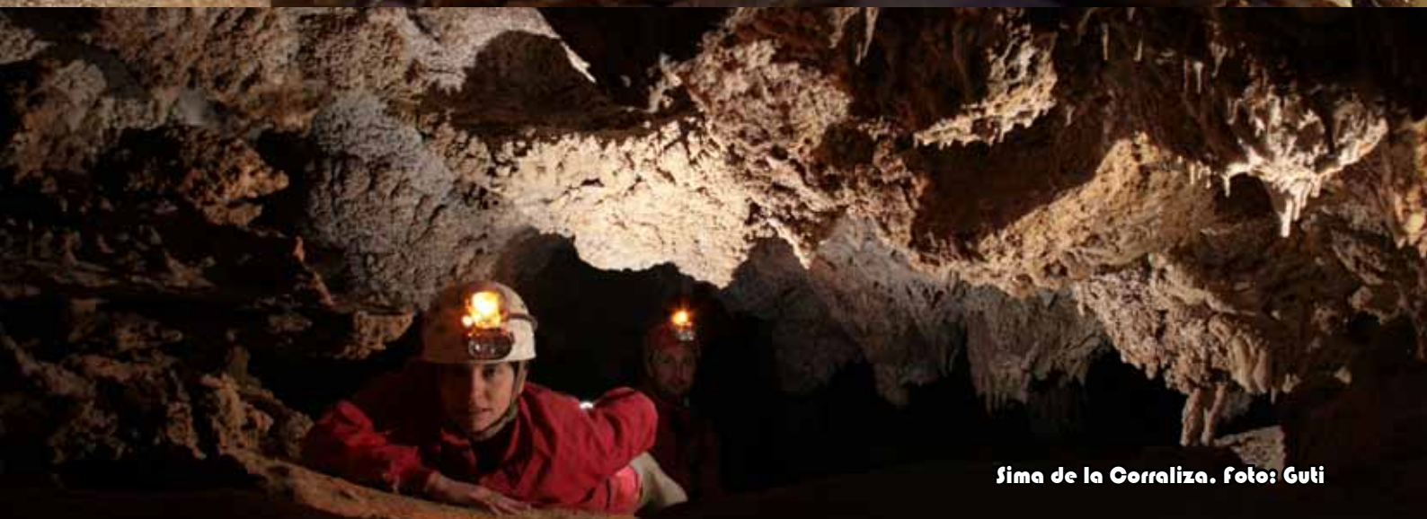
Sima de la Corraliza.