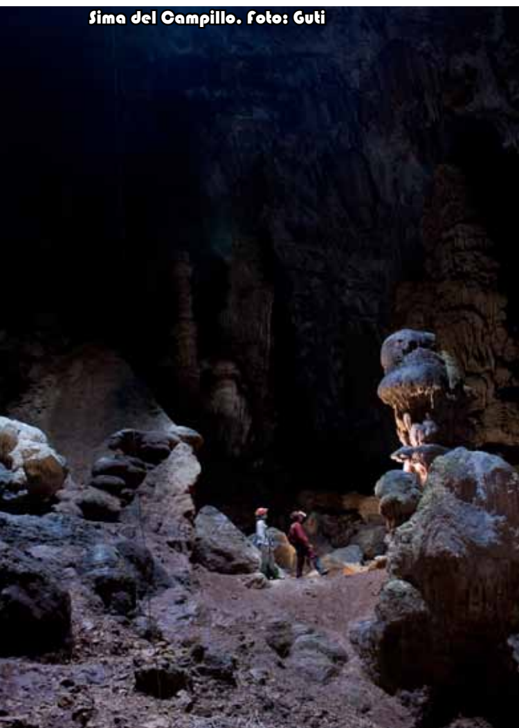
Sima del Campillo.