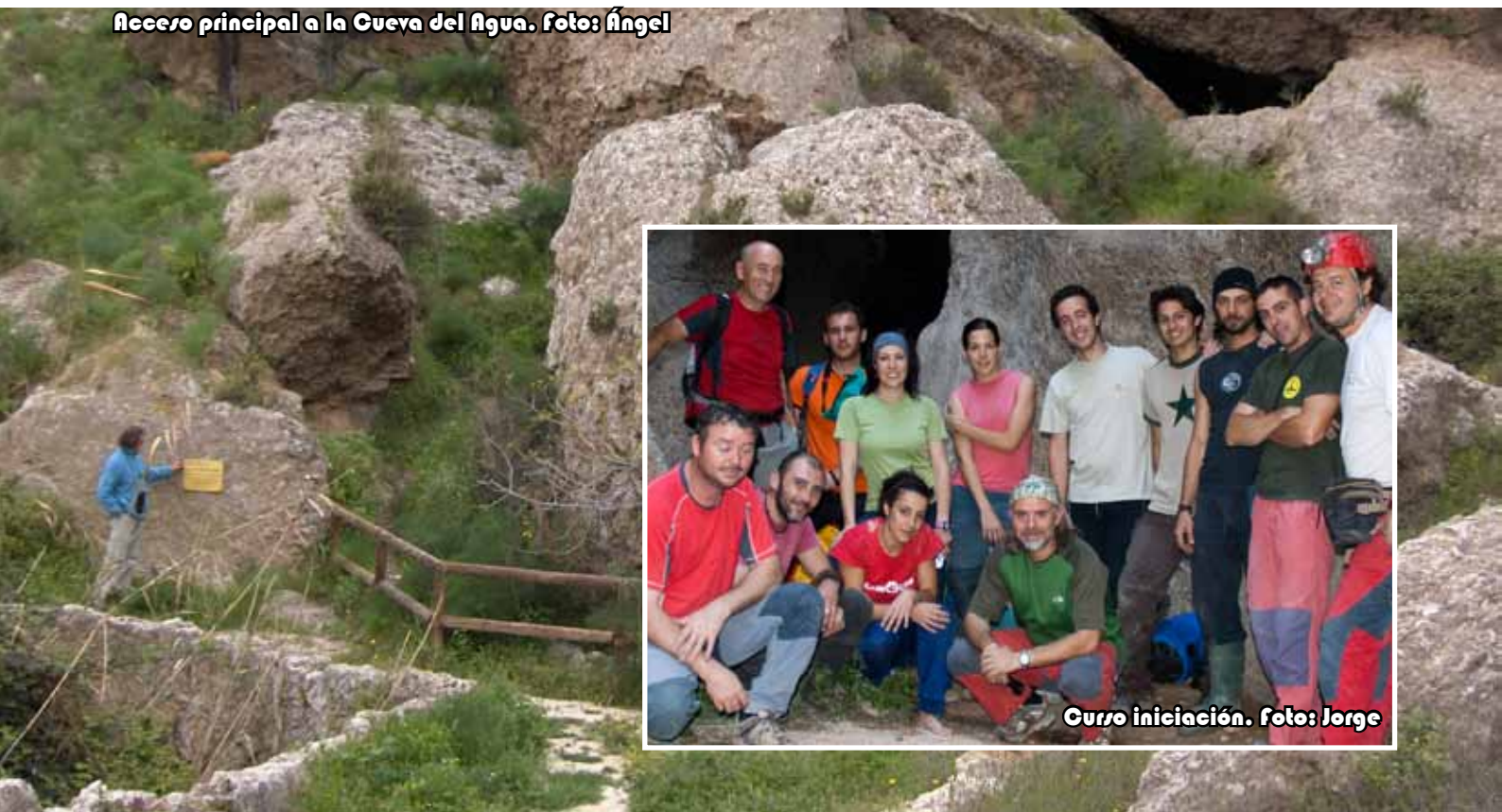
Acceso principal a la Cueva del Agua.