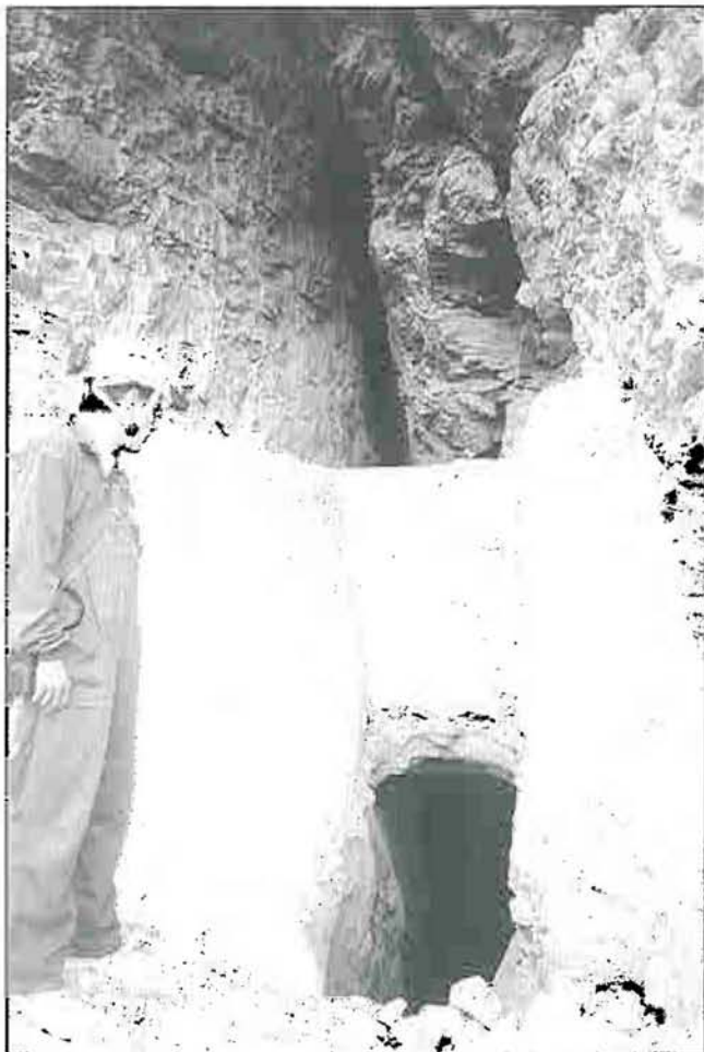
Entrada a la Cueva del Castillico de Córdoba.

Merino, en la que realizaron unas excavaciones en el interior de la cueva.